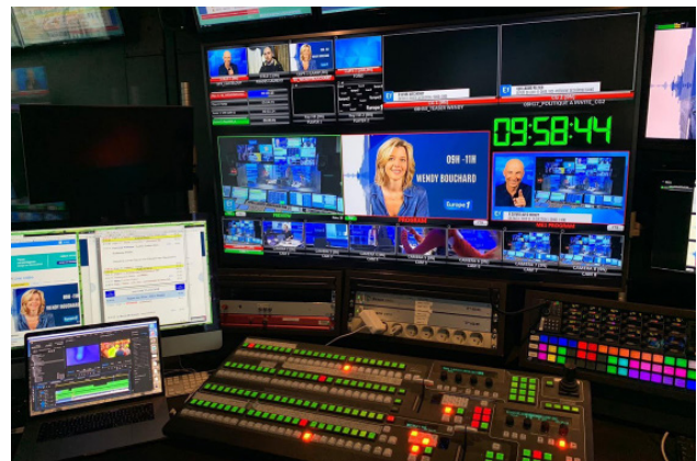
Studio Lagardère avec application multi-écrans desservie par les extenseurs vario Draco